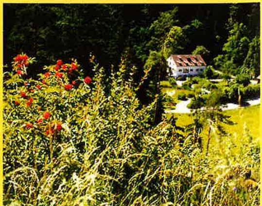
Blick auf Bachhaupt / Mauderer Mühle