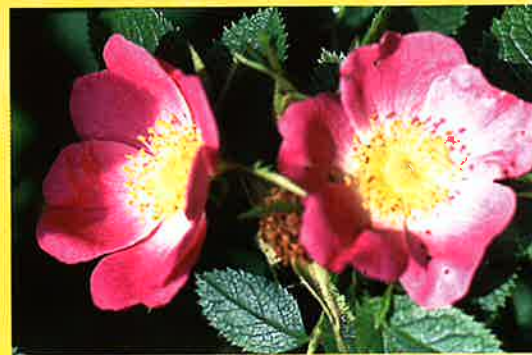
Weinrose ( Rosa rubiginosa )

Die Entdeckung der über 20 Wildrosenarten hier im Altmühljura kann zum großen Landschaftserlebnis werden. Im Wildrosengarten am Bucher Berg sind einige dieser Rosenarten in ihrem natürlichen Umfeld zu bestaunen. Anhand von verschiedenen Tafeln, die die jeweiligen Arten beschreiben, lernen Sie die Arten, ihre Ansprüche und ihr Umfeld kennen.